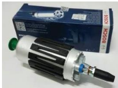
ปั๊มจ่ายน้ำมัน Bosch รุ่น EKP3A/จ่ายน้ำมัน 3 ลิตรต่อนาที จากประเทศเยอรมัน