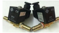
โซลินอยด์วาล์ว Parker 131.4FV, 1/4", Coil 220 VAC, ปะเก็นแบบ Fluoroelastomer