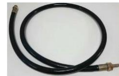
สายจ่ายน้ำมัน