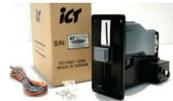
เครื่องหยอดเหรียญ ICT รุ่น UCASE