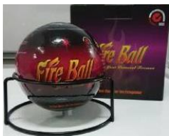
ลูกบอลดับเพลิง / ถังดับเพลิง