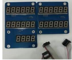
หน้าจอ LED , 6 Digit