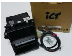
เครื่องรับธนบัตร ICT รุ่น NK77