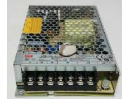
Mean Well Switching Power Supply : ขนาด 150 วัตต์, DC 12 Volt 1.25 Amp