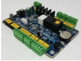
แผงควบคุมวงจรตู้น้ำมันที่มี ความทนทานและคุณภาพสูง